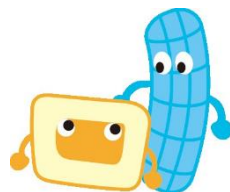
マルちゃん グルちゃん

じぎょうかいさい ぜんじつ じゅんび 事業開催の前日は準備のため、 4時30分以降卓球はできません。